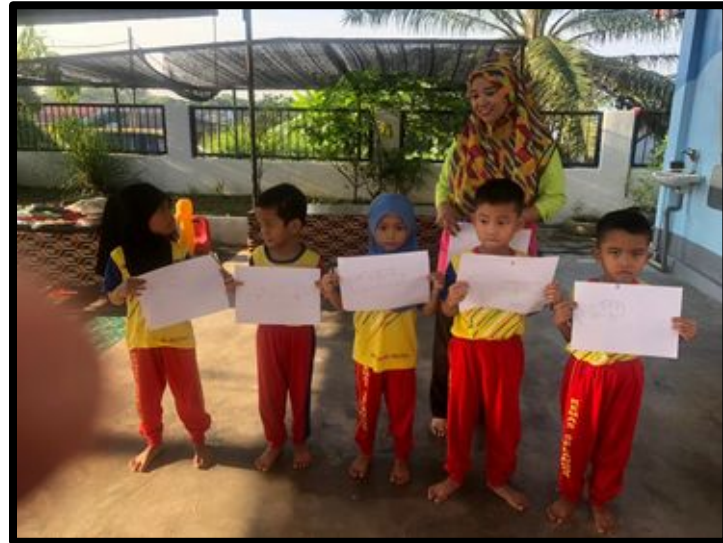
Kanak-kanak mempamerkan hasil kerja mereka